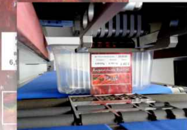
Het etiket wordt automatisch en precies over de rand aangebracht en vervolgens aangedrukt onder de rand.