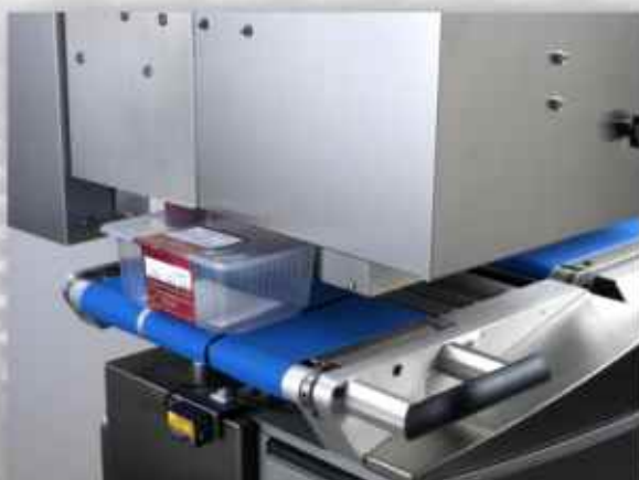
De machine etiketteert snel en uiterst flexibel.

De C-labelmodule kan, zonder extra benodigde ruimte, opgebouwd worden op bestaande machines van de ES 7000 reeks met trommeldrukker.