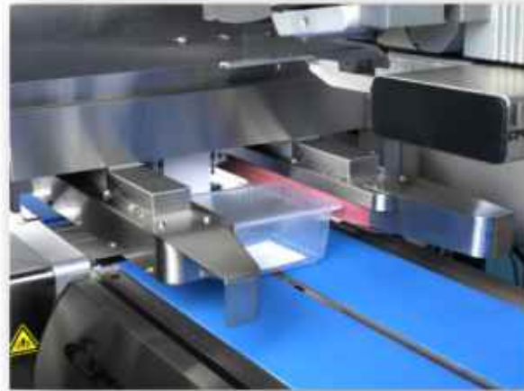
De verpakking wordt heel precies geleid door laterale geleiders.