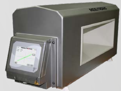
METRON tunneldetectorkop voor nauwkeurige detectie van alle ferro en non-ferro metalen delen