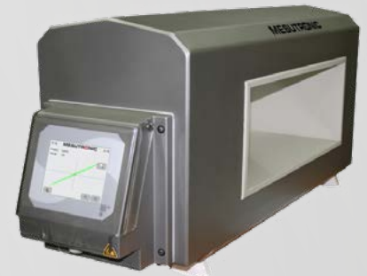
METRON tunneldetectorkop voor nauwkeurige detectie van alle ferro en non-ferro metalen delen