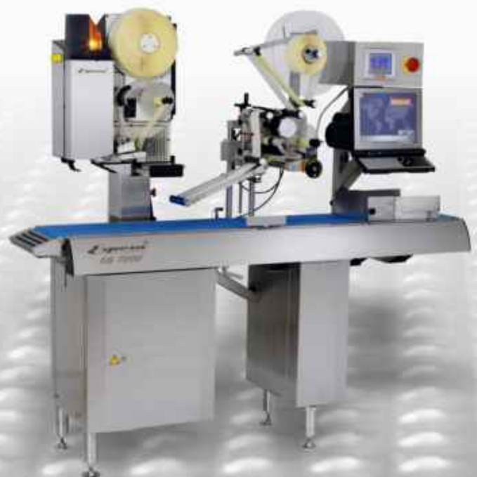
ES 1101 PN geïntegreerd in een ESPERA uitprijsmachine.