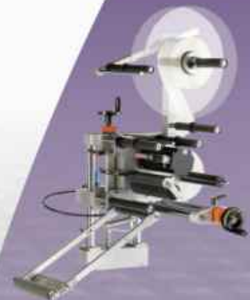
Optie: pneumatisch bekrachtigde labelafgiftearm