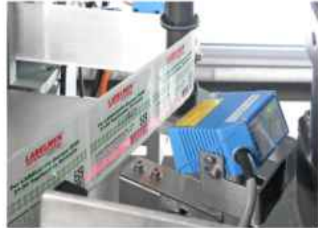
Scanner voor controle van een barcode