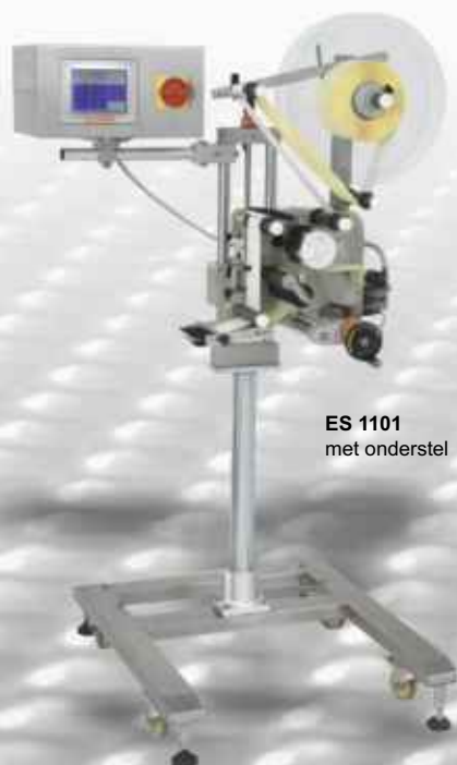
ES 1101 met onderstel

Door de flexibiliteit, eenvoudige bediening en vele toepassingsmogelijkheden is de ES 1101 zeer geschikt voor integratie met een verpakkingsmachine, maar ook om als zelfstandige etiketteermachine in de productielijn ingezet te worden.