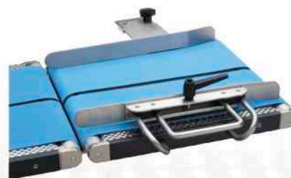
Nastro di carico / unità separazione pacchi opzionale