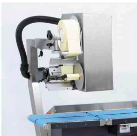
Stampante girata di 90°