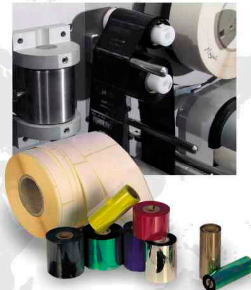
Attrezzatura per termotrasporto opzionale