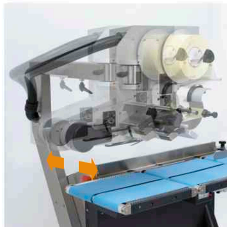
Posizionamento etichetta regolando lateralmente la stampante