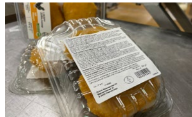
Erkennung von Schriftarten und Logos > 1,5 mm.

Standalone oder voll integriert mit den ESPERA Auszeichnungssystemen der Generation NOVA bietet das neue Vision Inspektionssystem maximale Qualitätskontrolle für den Etikettierprozess.